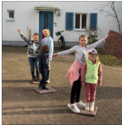
Kinderchor auf dem Pfarrhof beim Spielen