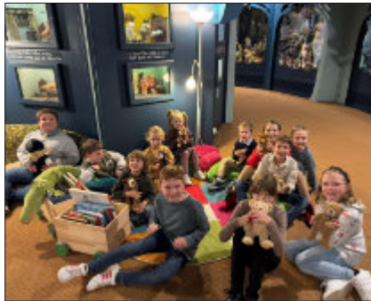
Kinderchor im Museum für deutsche Spielzeugindustrie

Doch hier geht es um viel mehr als nur Musik: Natürlich stehen Lieder und Auftritte im Mittelpunkt, aber genauso wichtig sind Gemeinschaft, Spaß und die persönliche Entwicklung jedes einzelnen Kindes. Ob bei der Eröffnung einer Sonderausstellung im Puppenmuseum, beim eigenen Sankt-Martins-Umzug oder beim Weihnachtsmusical „Leuchte nochmal, großer Stern“ – die Kinder zeigen immer wieder mit Begeisterung, was in ihnen steckt.